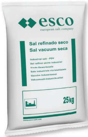
SAL SECO REFINADO 25KG 50013099021

Uma pequena amostra da vasta e completa gama de produtos que temos para si!